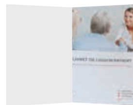
Le classeur de liaison

Avec votre accord, votre dossier sera présenté en Réunion de Concertation Pluridisciplinaire (RCP) où un schéma de prise en charge vous sera proposé. Si vous l'acceptez, le médecin qui vous suit à l'ICO vous mettra en relation avec les autres médecins spécialistes dont vous aurez déterminé ensemble la liste.